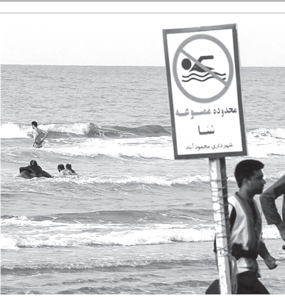
رئیس اداره استثنایی اداره کل آموزش و پرورش مازندران:

تحصیل ۶۰ درصد دانش آموزان معلول مازندران در مدارس عادی